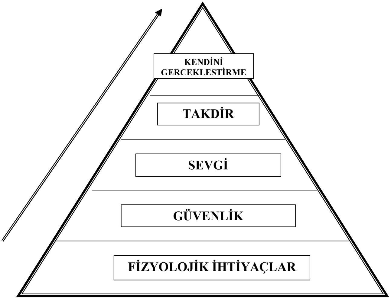
Şekil 1. Maslow'un İhtiyaçlar Hiyerarşisi

Fizyolojik gereksinimler: Yemek yemek (su, tuz, şeker, protein, kalsiyum ve diğer minerallerin alınması için), hava, uyku, ph dengesi ve sıcaklığın korunması, hareket etmek, uyumak, vücut atıklarından kurtulmak, acıdan kaçınmak ve seksi içeren temel ihtiyaçlardır.