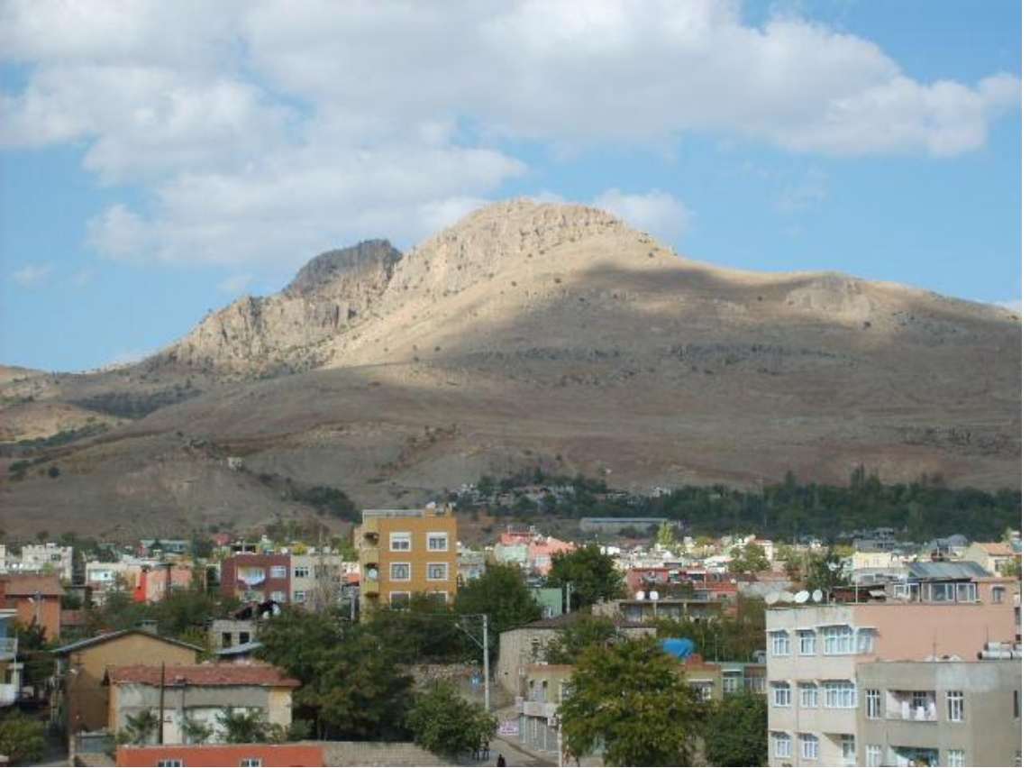
Zülkif'ül Peygamber Dağı