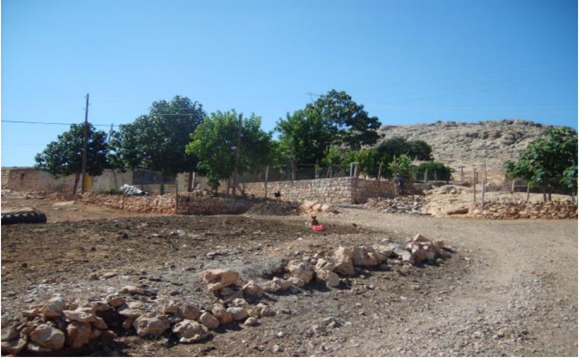
Yukarı Karpuzlu Köyü'nden bir görünüş