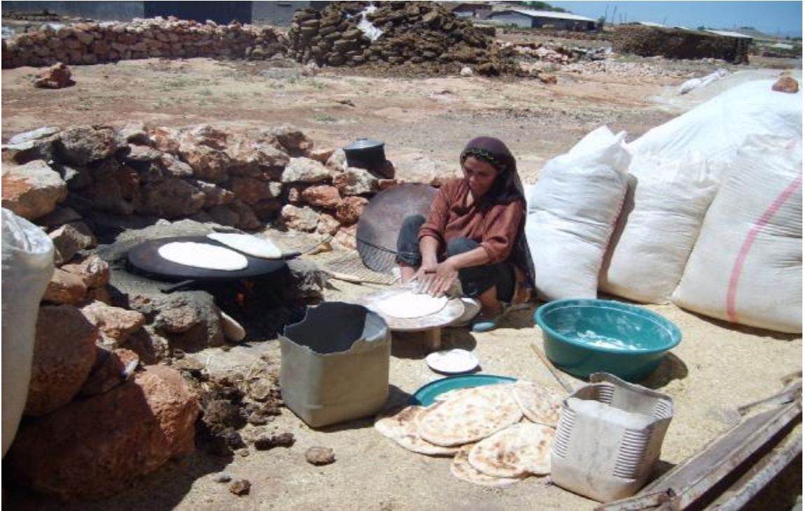
Ahmetli Köyü'nde ekmek yapan kadın