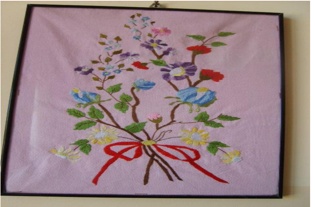
El işi tablolar