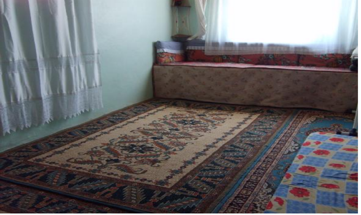
Hoşan Köyü'nde bir oda