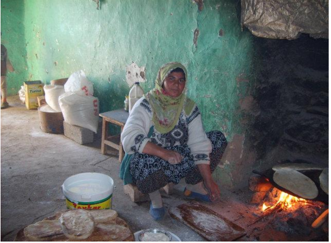
Ahmetli Köyü'nde ekmek yapan kadın