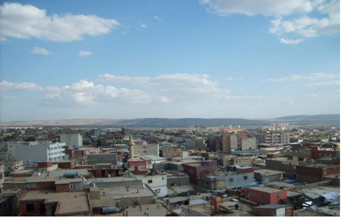
Ergani İlçe Merkezi'nden bir görünüş