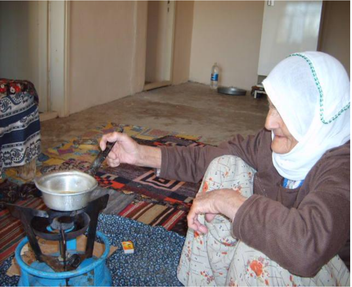
Kurşun dökmeye hazırlanan kadın