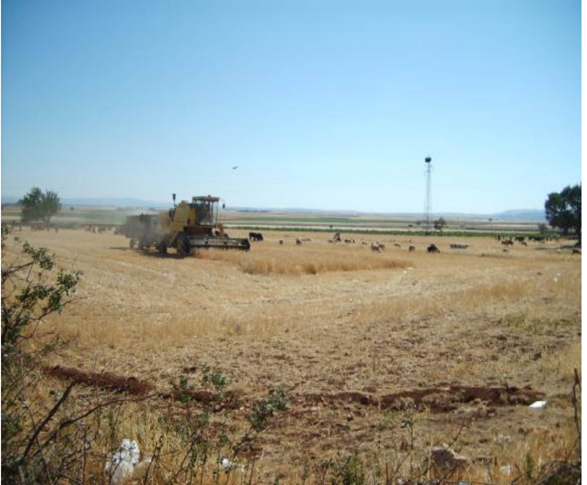
Aşağı Gedıcık Köyü'nde hasat